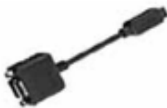
付属外部出力 ケーブル