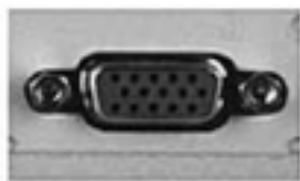
ミニ D-sub 15pin コネクタ